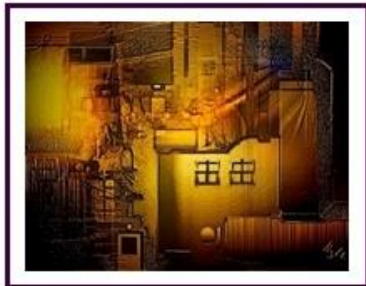
A város sűrűjében

Kedves Barátaink, Ismerőseink, Polgártársaink! A Kopogtatóban 2 havonta az alábbi formátumban, 2-2 munkánkat mutatjuk be. Ezzel szeretnénk néhány kellemes pillanatot szerezni Önöknek! Az interneten a Mezős Béla név beütésével egyéb információt is találhatnak rólunk. Bort, búzát, békességet mindenkinek!