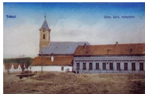
Az iskola épülete 1905-ben

Az iskolaszék figyelemmel kísérte a gyermekek iskolába járását is. Sok esetben a szülők otthon tartották gyermekeiket, mert szükség volt munkájukra. Télen pedig azért, mert nem volt a gyermeknek lábballije, vagy a családban több gyermeknek volt egypár cipője- csizmája és a testvérek felváltva jártak benne iskolába. Többnek még tanszere sem volt. 1859-ben pl. 35 szegény tanuló járt tankönyvek nélkül iskolába, fiznek hiányzott az „első nyelvgyakorló könyve, huszonötnek az ABC-s olvasókönyve.