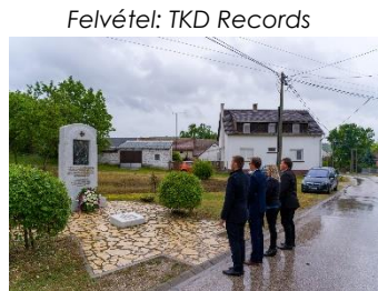
Bánhidi László - polgármester

Május 31. A vasárnapi misét követően, Hősök napja alkalmából megkoszorúztuk képviselőtársaimmal az I. és II. világháborús emlékműveket, valamint a nemrégiben kialakított szovjet hősi emlékművet. A kialakult járványügyi helyzet nem tette lehetővé a nagyobb tömeget vonzó megemlékezés megszervezését.