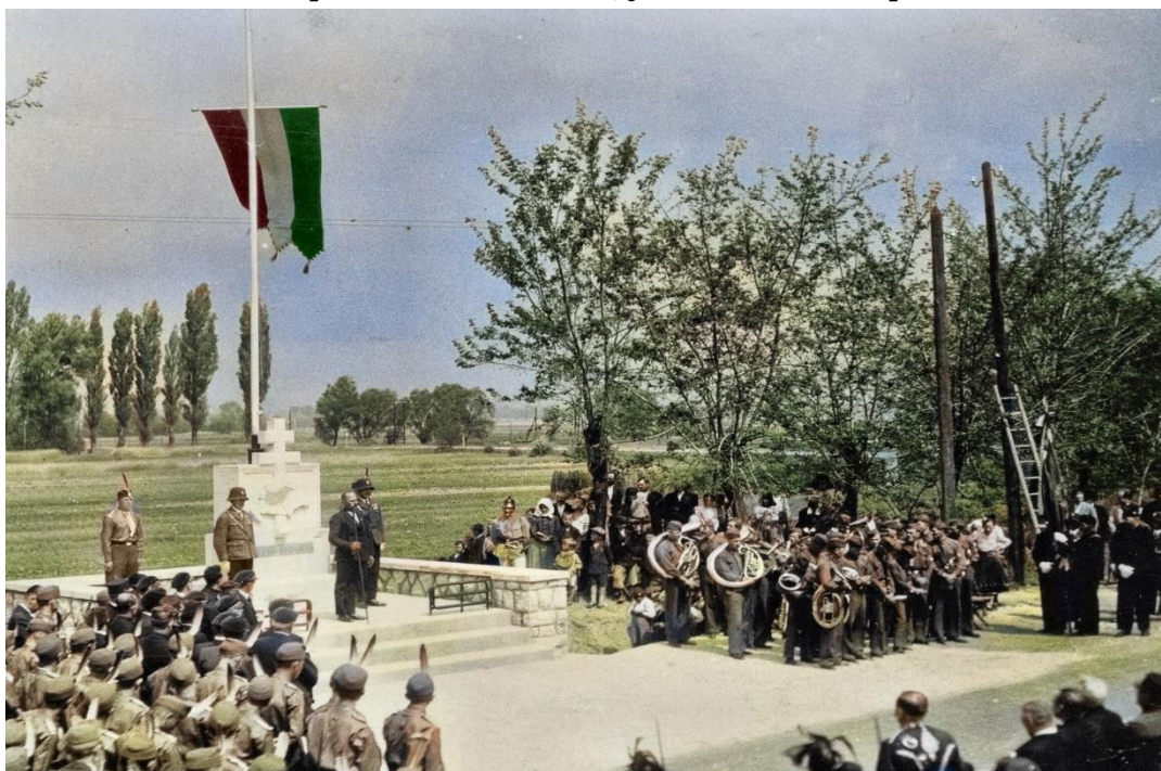
Tokodi Trianoni emlékmű országzászlóval, amely 1938 és 1948 között állt a mai községházával szemben.

100 évvel ezelőtt, 1920. június 4-én kötötték meg az I. világháborút Magyarország számára lezáró békeszerződést a Párizs mellett Versailles városában található Nagy-Trianon palotában. Ezen szerződés magában foglalta az Osztrák-Magyar Monarchia, ezzel együtt a királyi Magyarország felbontását, Közép-Európa területén új, önálló nemzetállamok létrehozását. Magyarország ezzel elvesztette a Felvidéket, Kárpátalját, Erdélyt, a Vajdaságot, a horvát területeket és az Órvidéket, számos jelentős oktatási intézményét, bányáit és vasútjait. A legnagyobb megrázkódtatás azonban azon honfitársainkat érte, akiknek családját, embertársait választotta el egymástól az újonnan kialakított országhatár. 100 év elteltével, 2020-ban a területi revízióra irányuló törekvések a hagyományos értelmükben már nem aktuálisak. Napjainkban azon kell dolgoznunk, hogy megtaláljuk a módot a Kárpát-medencében élő valamennyi magyar honfitársunkkal való kapcsolat kialakítására, fenntartására és ápolására.