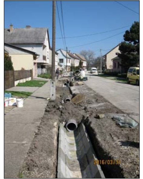
Béke tér - új árok és áttereszek