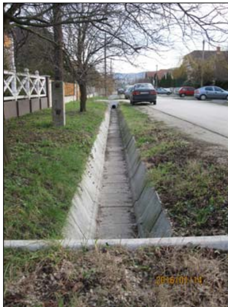
Liszt Ferenc u. - árok tisztítás