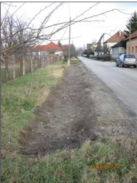
József Attila út - földárok karbantartás