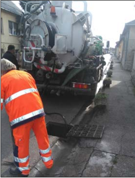
Árpád utca - csatorna tisztítás