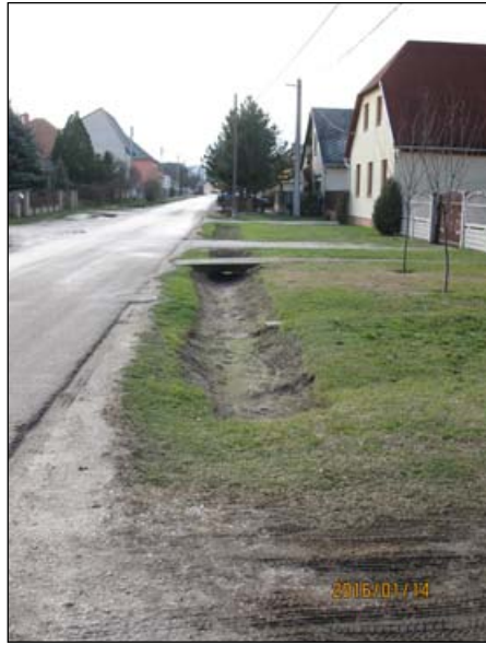
Babits utca - földárok karbantartás