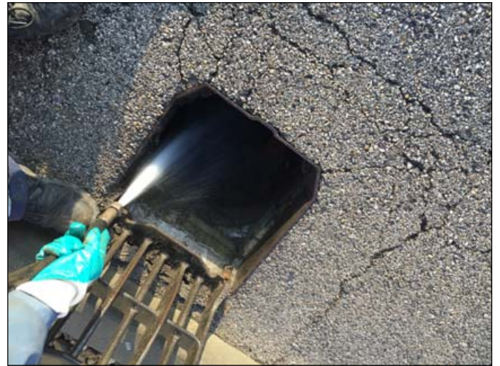
Mogorósbányai út - csatorna tisztítás