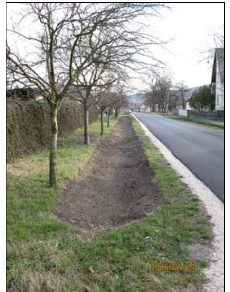
Vak Bottyán u. - földárok karbantartás

Az EGT Alapok és a Norvég Alapok révén Izland, Liechtenstein és Norvégia hozzájárul a társadalmi és gazdasági különbségek csökkentéséhez, valamint kedvezményezett országokkal való kétoldalú kapcsolatok erősítéséhez Európában. A három ország az Európai Gazdasági Térségről (EGT) szóló megállapodás révén szorosan együttműködik az EU-val.