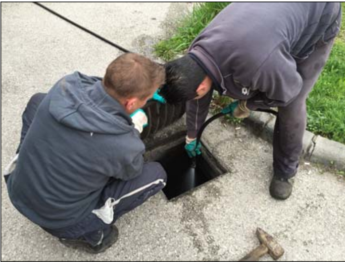
Fő út - csatorna átmosás